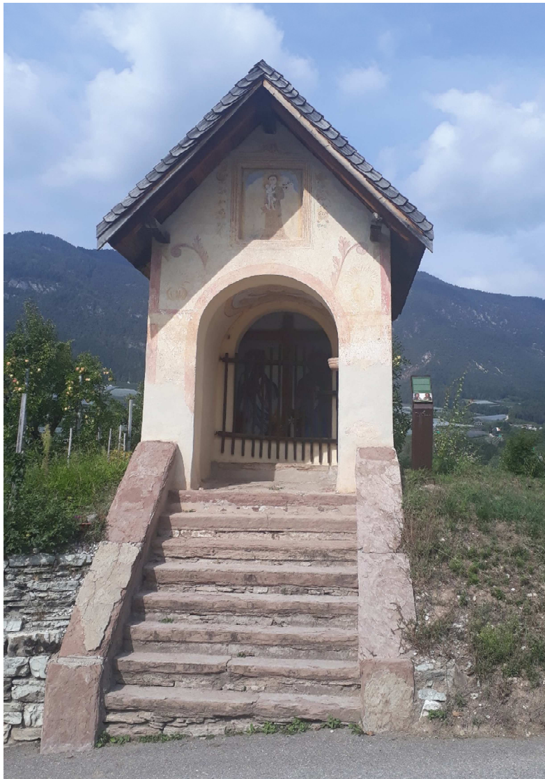
Vista da est